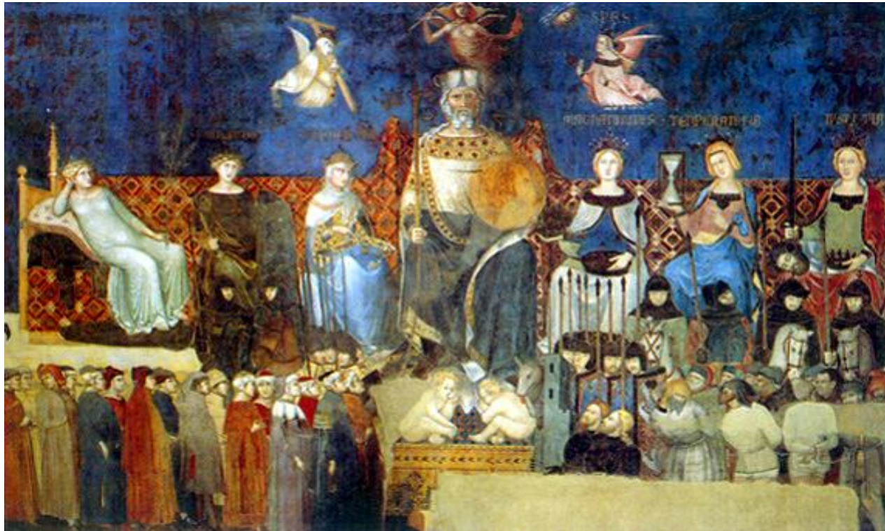
Allegoria del Buon Governo, 1338-1339, Sala della Pace, Palazzo Pubblico, Siena